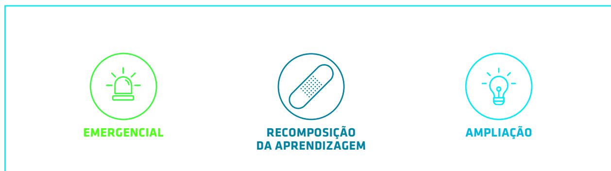
FIGURA 2 – CENÁRIOS NORTEADORES PARA A FORMULAÇÃO DE POLÍTICAS E REGULAMENTAÇÃO DA APRENDIZAGEM HÍBRIDA NO BRASIL