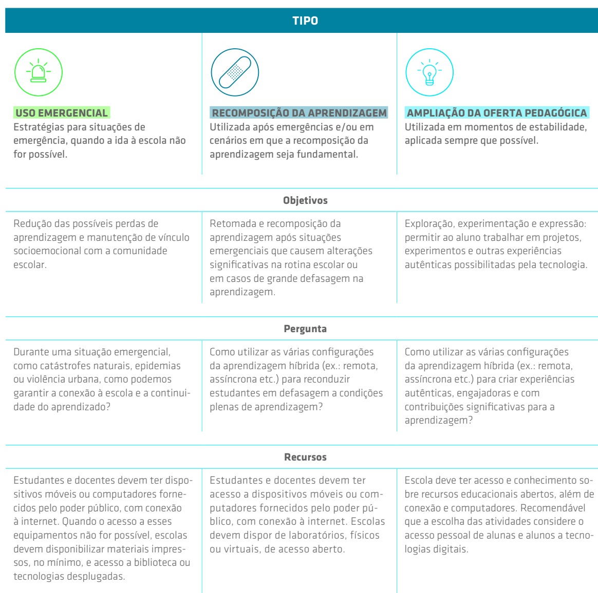
FIGURA 3 – CONSIDERAÇÕES PARA O USO DA APRENDIZAGEM HÍBRIDA

recomposição de aprendizagem e ampliação da oferta pedagógica. Para cada um dos tipos, apresentamos os objetivos, a pergunta central que motiva seu uso, os recursos necessários e as considerações que julgamos relevantes.